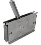
Outils de maintien Roxtec